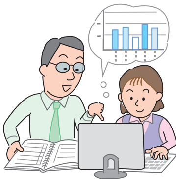
図1 繰越税額控除制度のイメージ

この規定の適用を受ける場合には、賃上げ促進税制の適用を受けた事業年度以後の各事業年度の確定申告書等に、明細書を添付する必要があります。